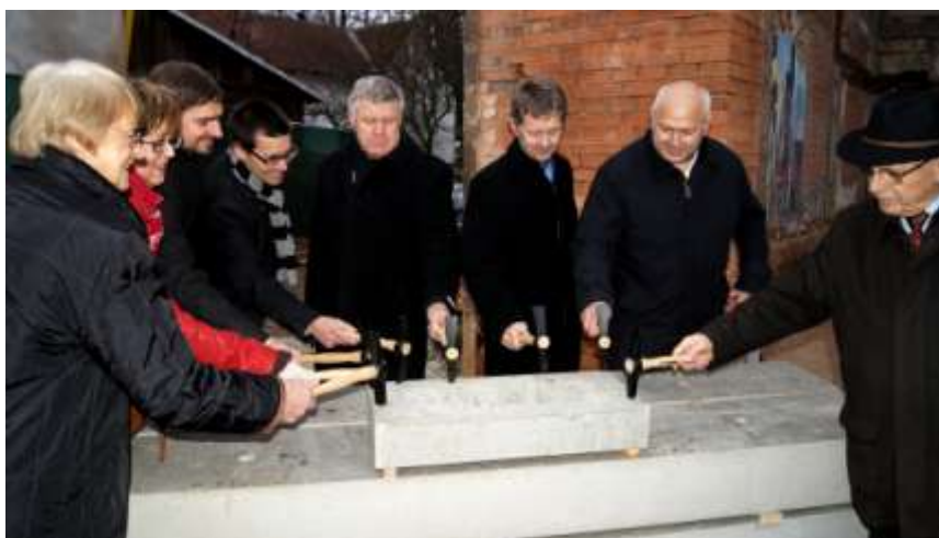
listopad 2012, Základní kámen Spolkového domu