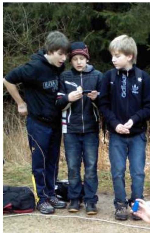
Duben 2012, výuka žáků základních škol