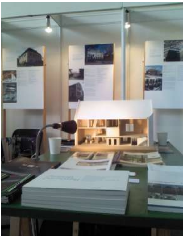
Říjen 2012, veletrh PAMÁTKY, stánek Zelené památky