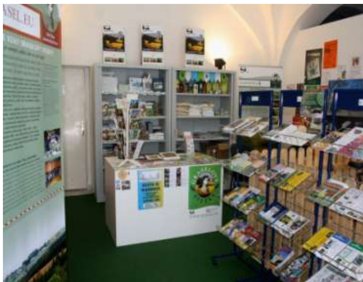
Návštěvnícké centrum 2012