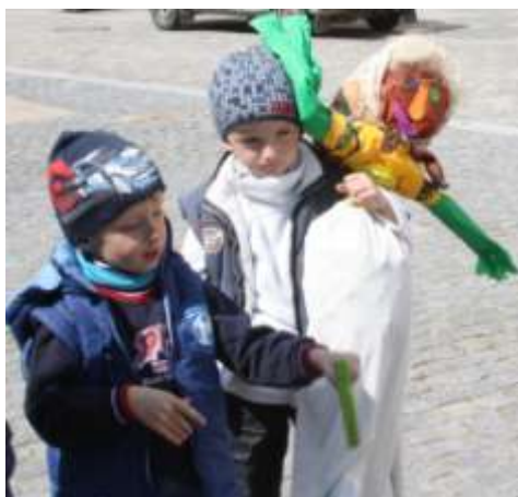
duben 2012, topení Morany