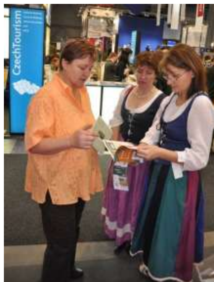
leden 2012, propagace GS na veletrhu Regiontour v Brně