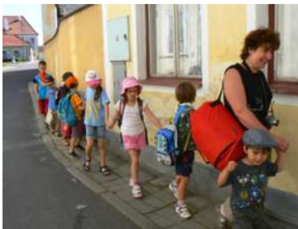
srpen 2012, letní denní programy